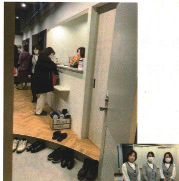
扉を開けた横の受付とスタッフさん