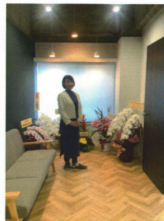
待合はちょっとおしゃれなカフェみたい