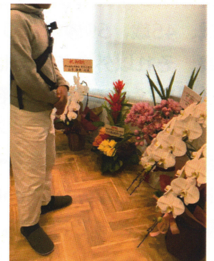
たくさんのお花をお祝いいただきました