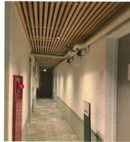
クリニックのあるフロアの廊下

当日はお忙しいにもかかわらず、たくさんの方々がお祝いにかけてくれましたよ。 本当にありがとうございました〜！！